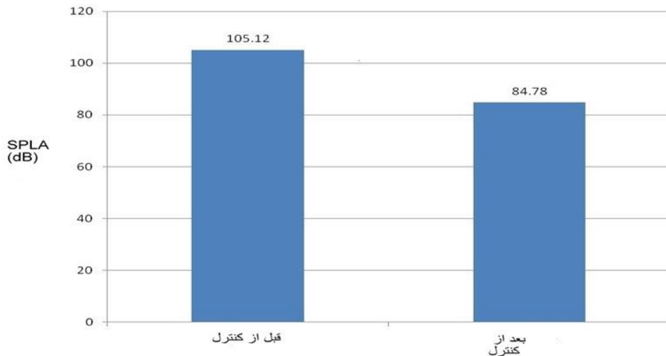
نمودار ۱. میانگین تراز کل فشار صوت قبل و بعد از اقدامات کنترلی